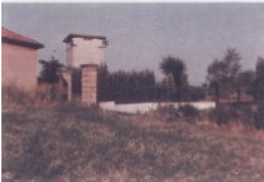
Sede della postazione