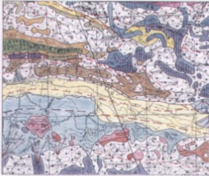
SEZIONE GEOLOGICA A-A' scala 1:50000