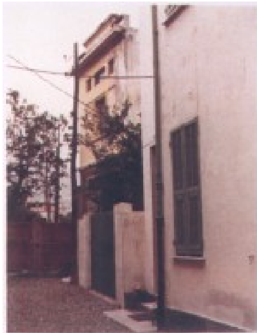
Sede della postazione