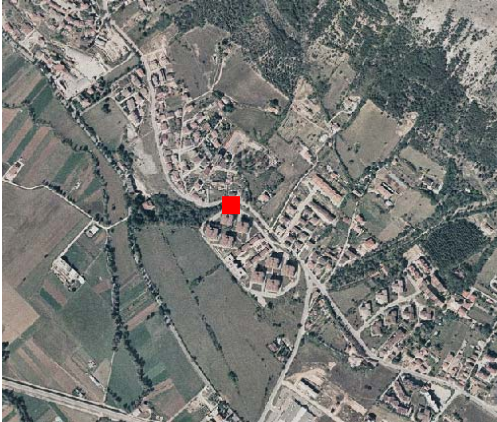
Foto aerea con localizzazione sito stazione