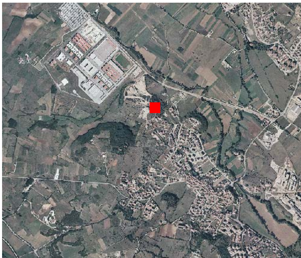
Foto aerea con localizzazione sito stazione