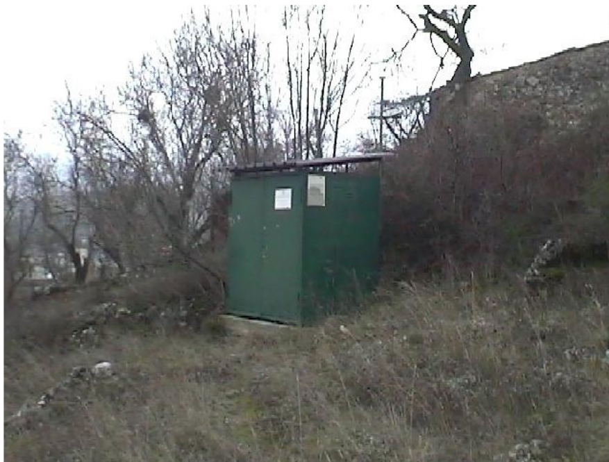
Sede della postazione