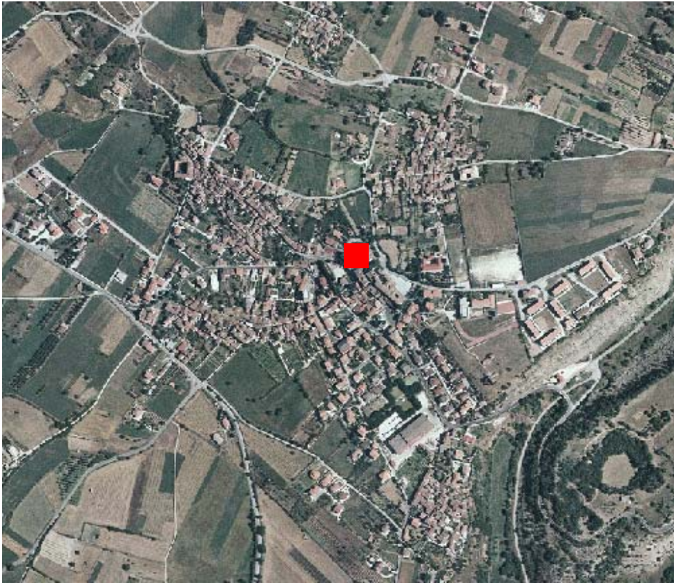
Foto aerea con localizzazione sito stazione