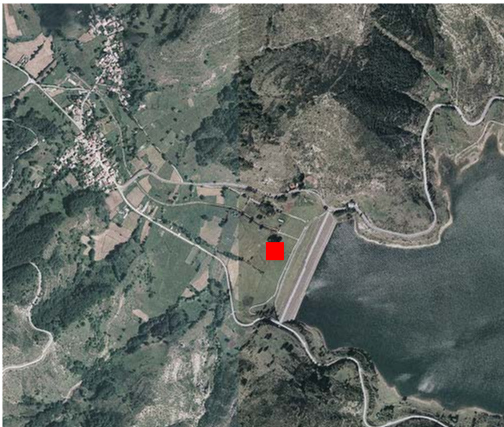
Foto aerea con localizzazione sito stazione