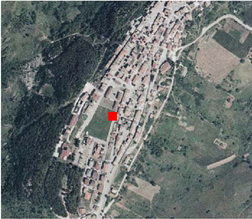
Foto aerea con localizzazione sito stazione