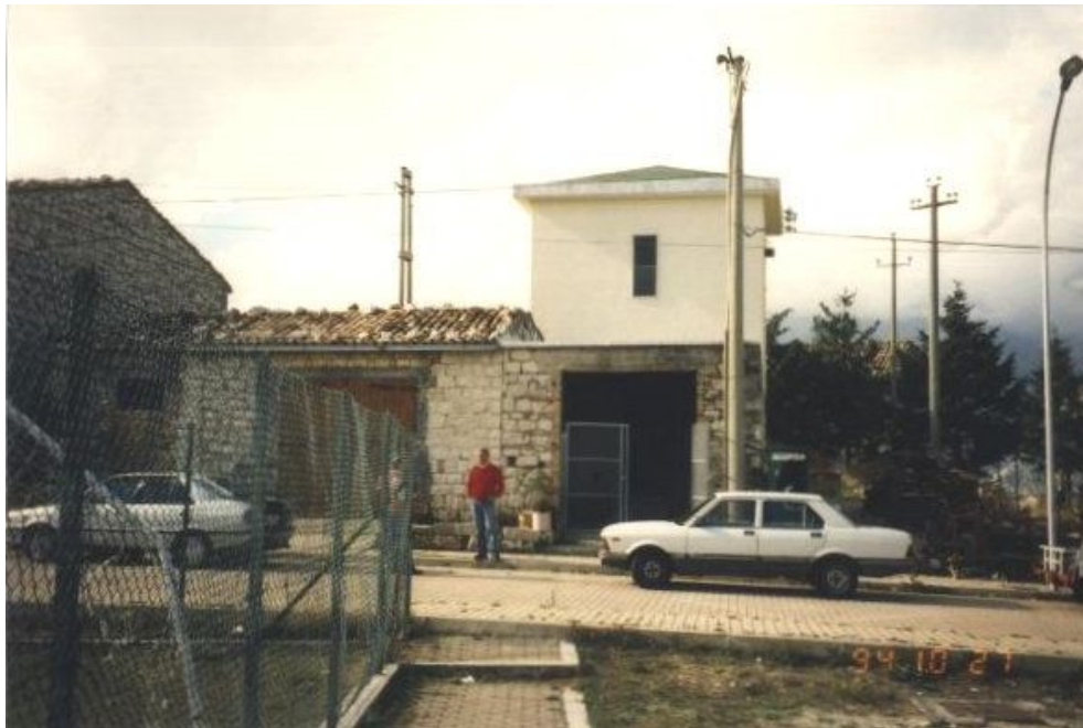
Sede della postazione