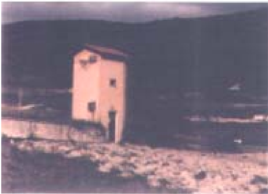
Sede della postazione