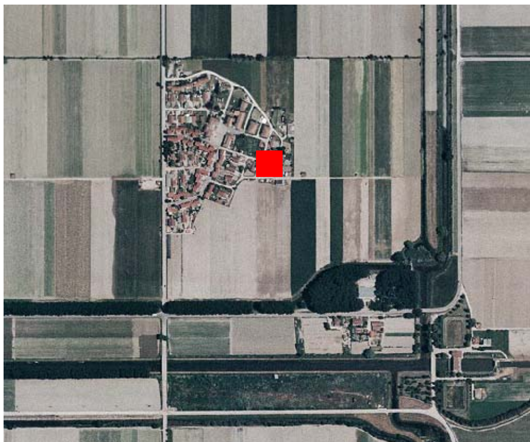
Foto aerea con localizzazione sito stazione