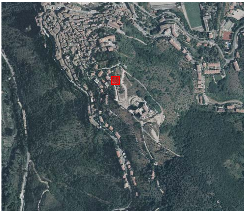
Foto aerea con localizzazione sito stazione