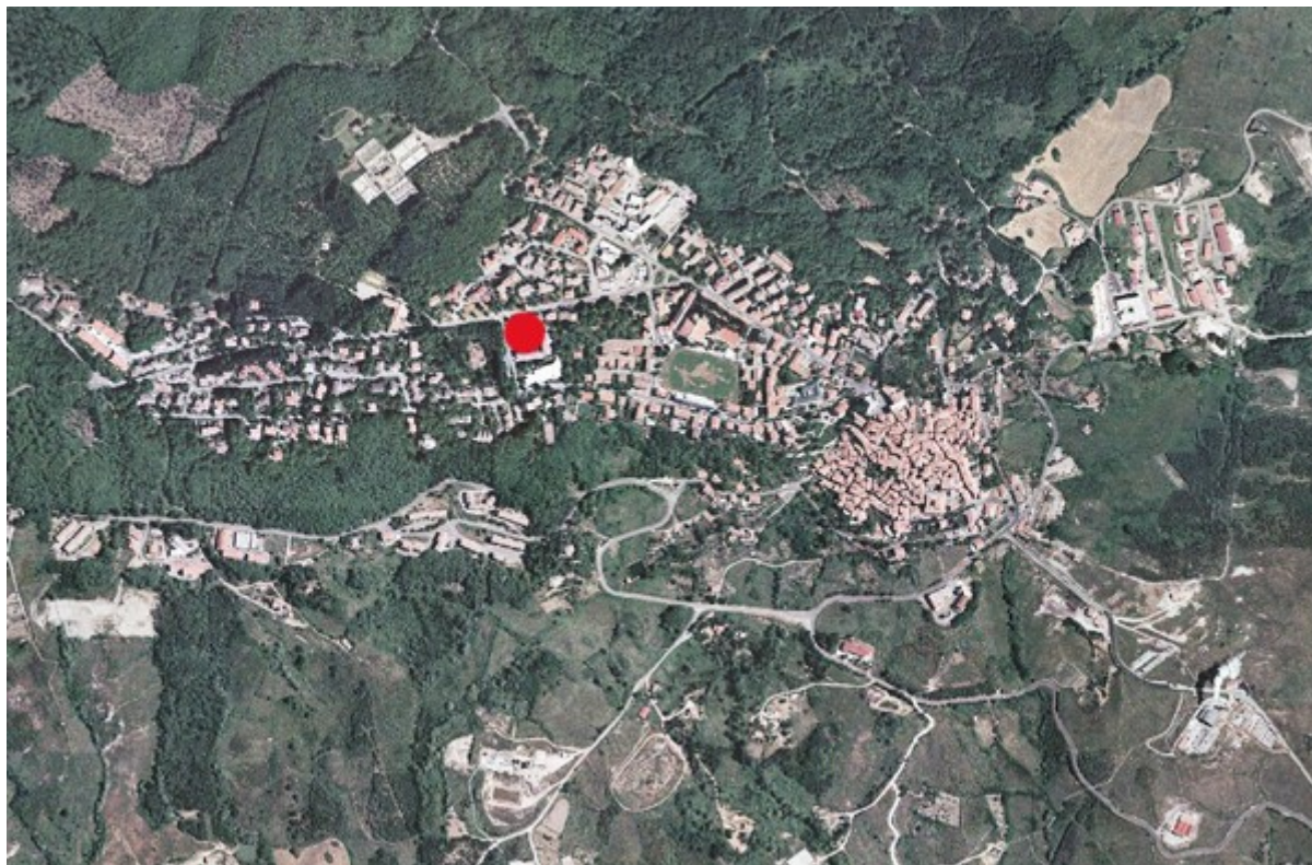
Foto aerea con localizzazione sito stazione