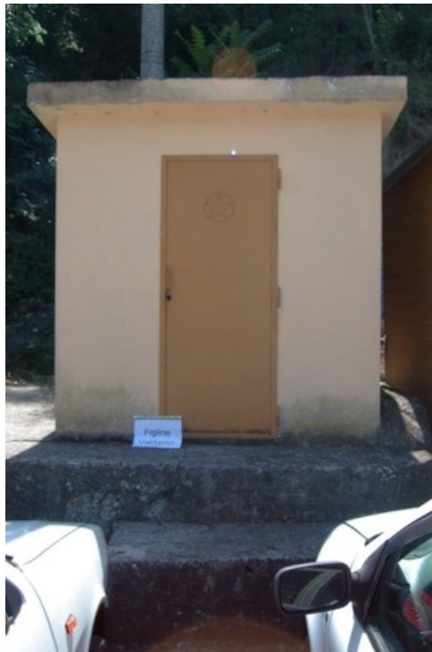
Sede della postazione