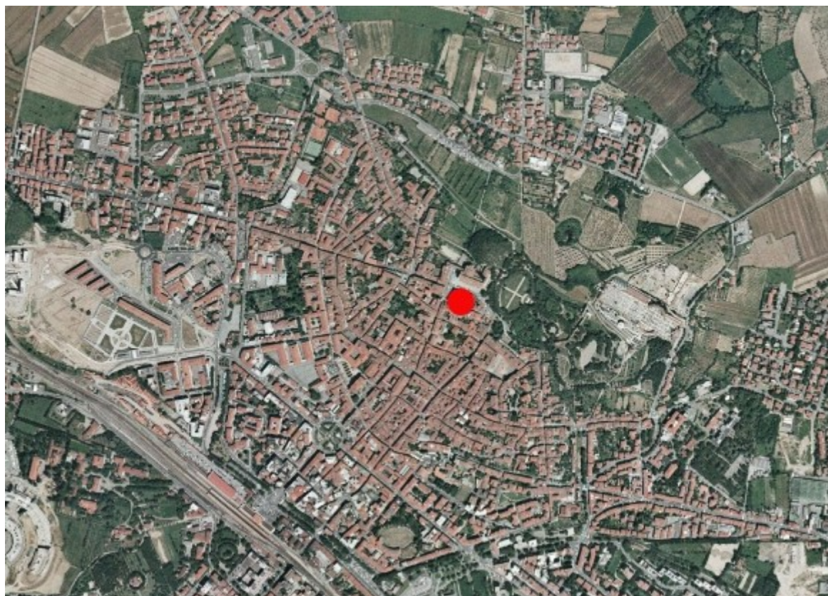
Foto aerea con localizzazione sito stazione