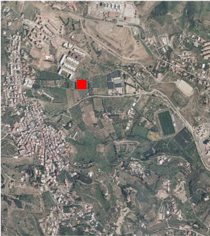
Foto aerea con localizzazione sito stazione