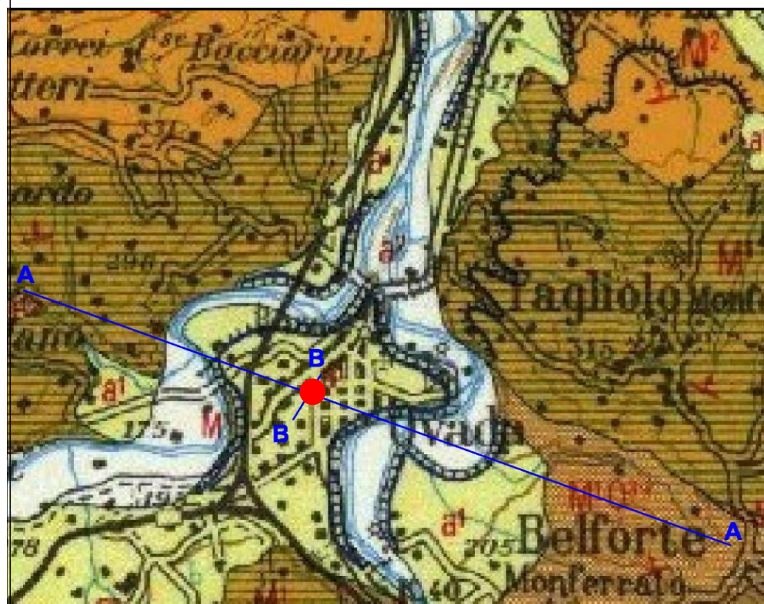
Carta geologica (scala 1:25.000)