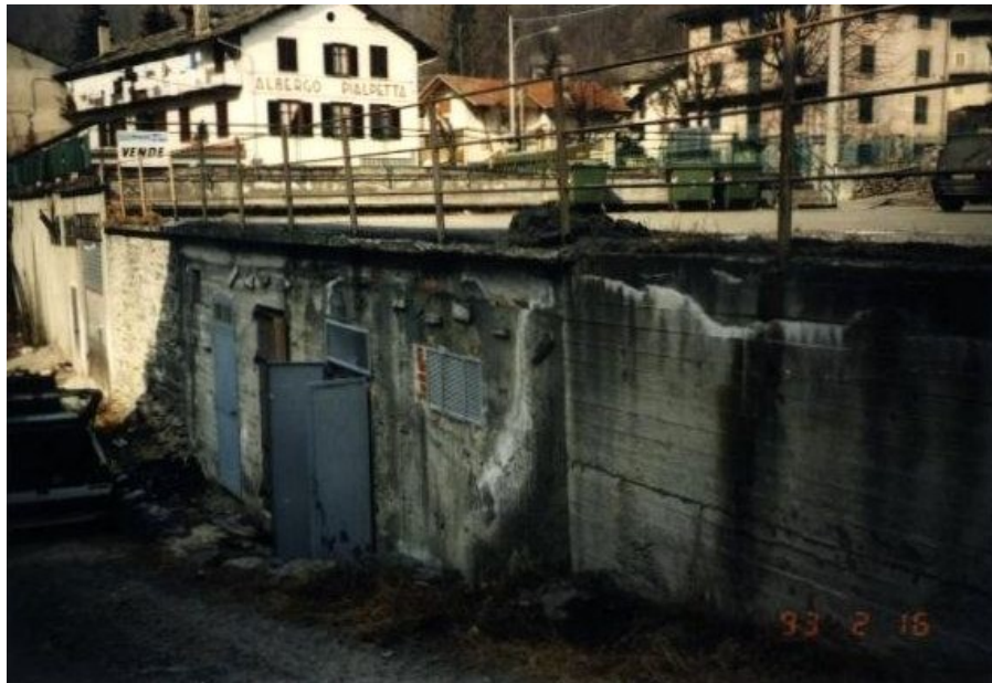
Sede della postazione