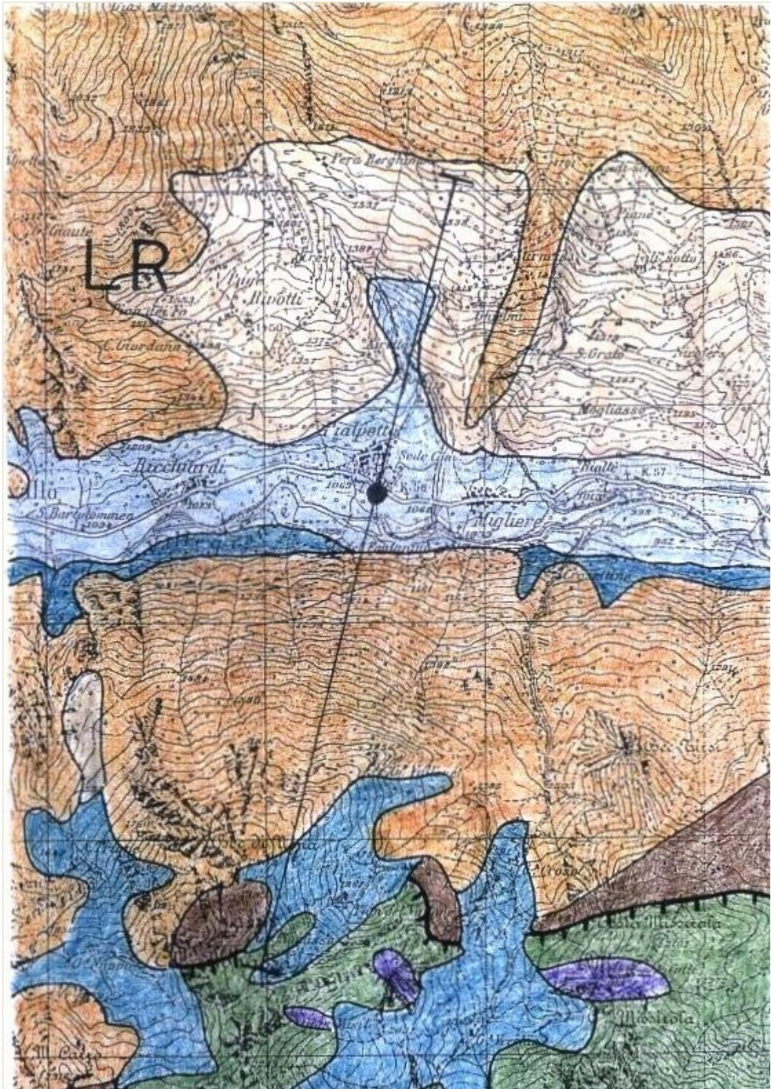
Carta geologica estratta dalle monografie dell'Enel