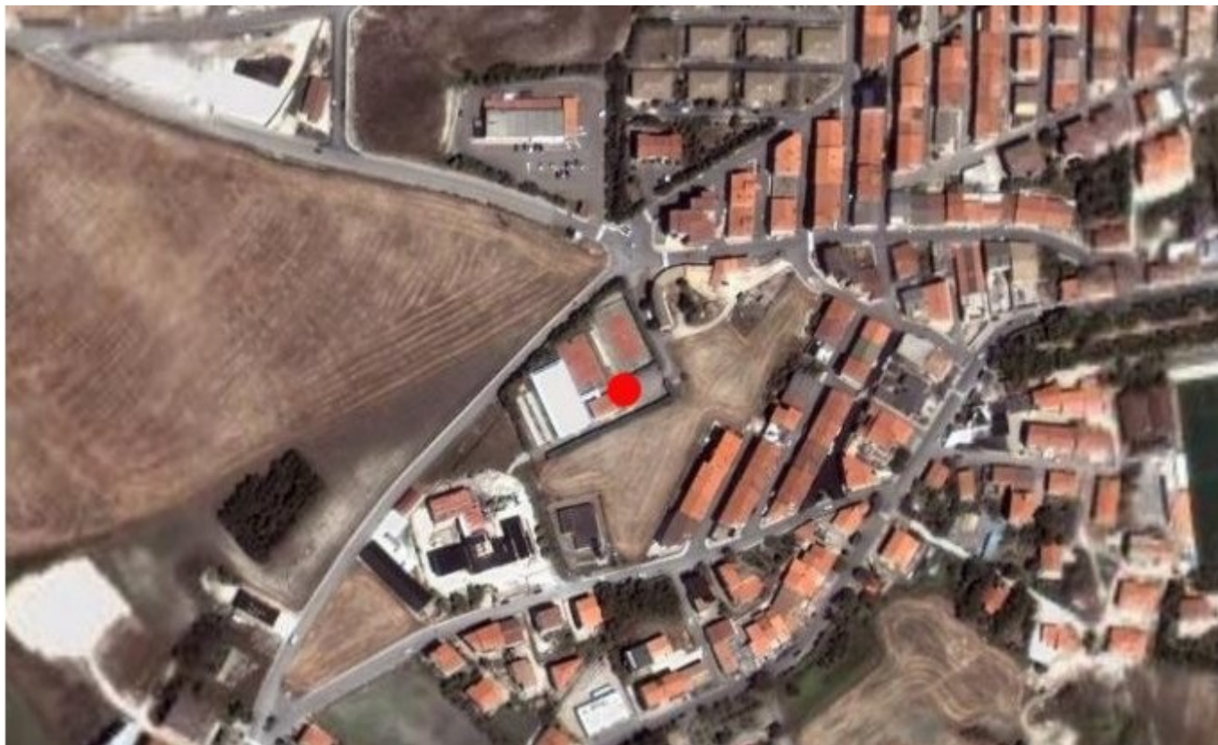
Foto aerea con localizzazione sito stazione