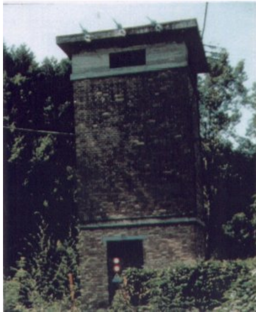
Sede della postazione