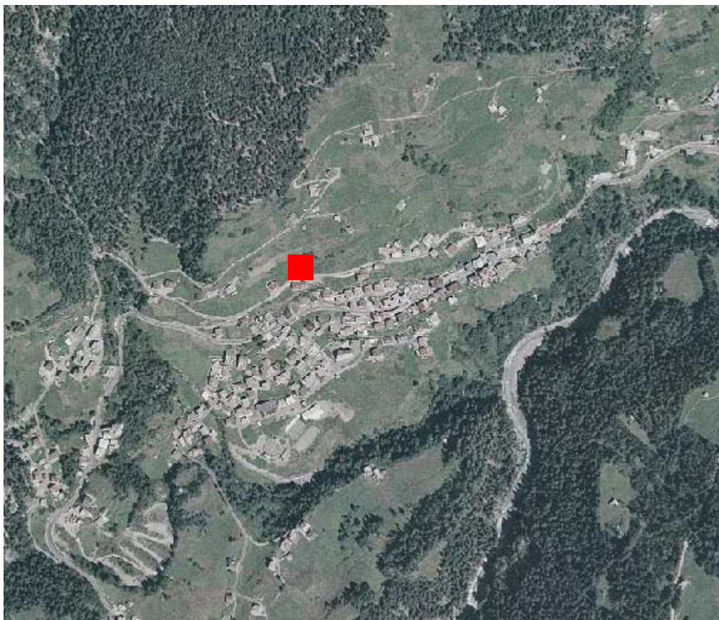
Foto aerea con localizzazione sito stazione