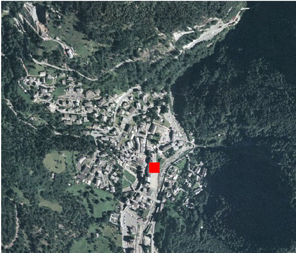
Foto aerea con localizzazione sito stazione