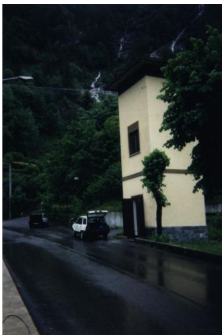
Sede della postazione