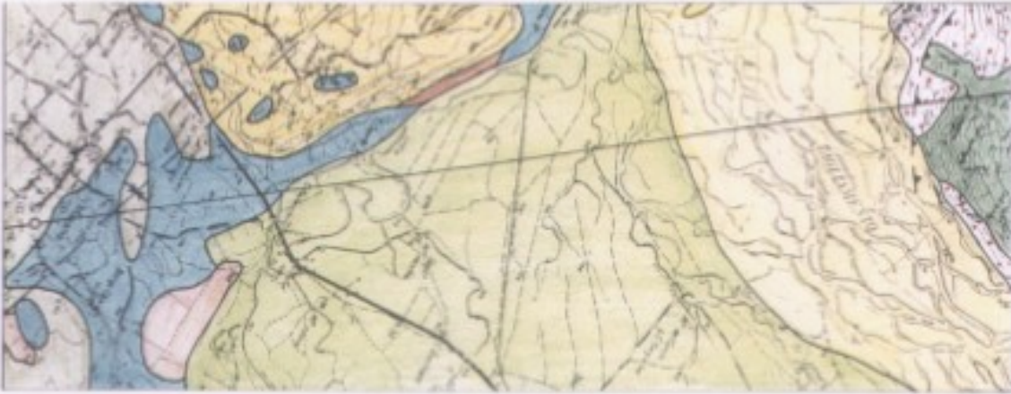
SEZIONE GEOLOGICA A-A' scala 1:50000