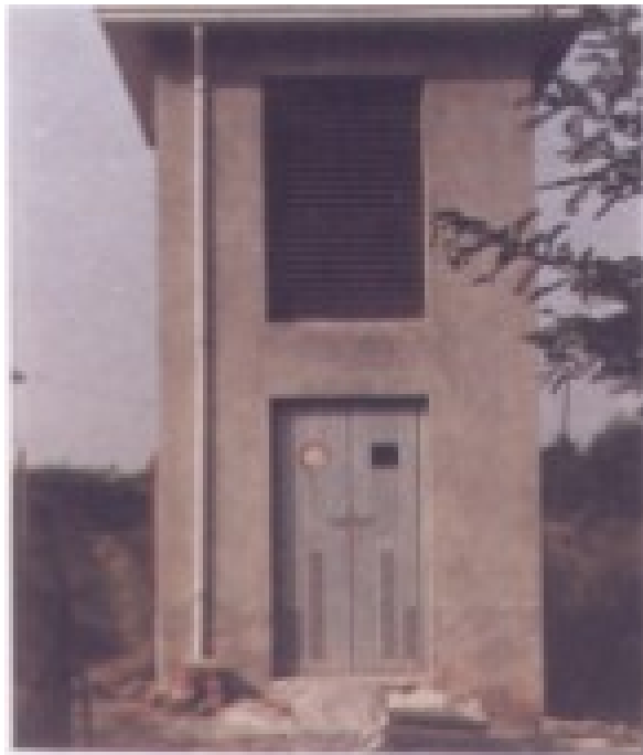
Sede della postazione