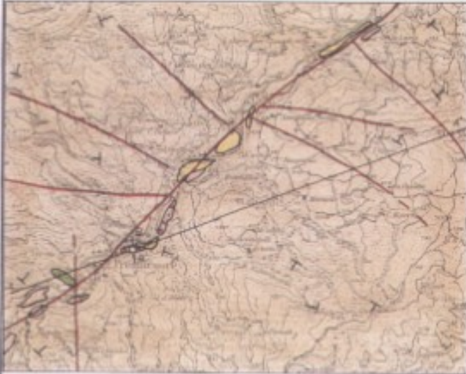
CARTA GEOLOGICA scala 1:50000