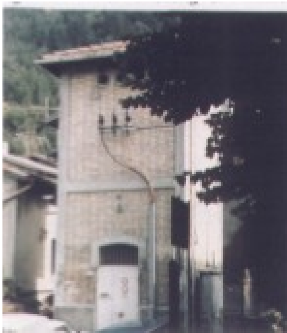
Sede della postazione