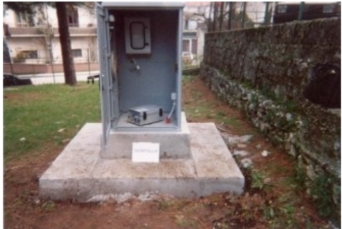
Sede della postazione