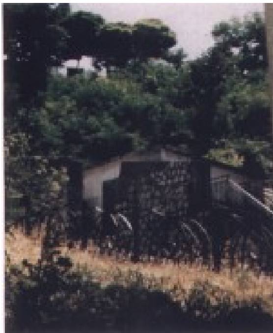
Sede della postazione