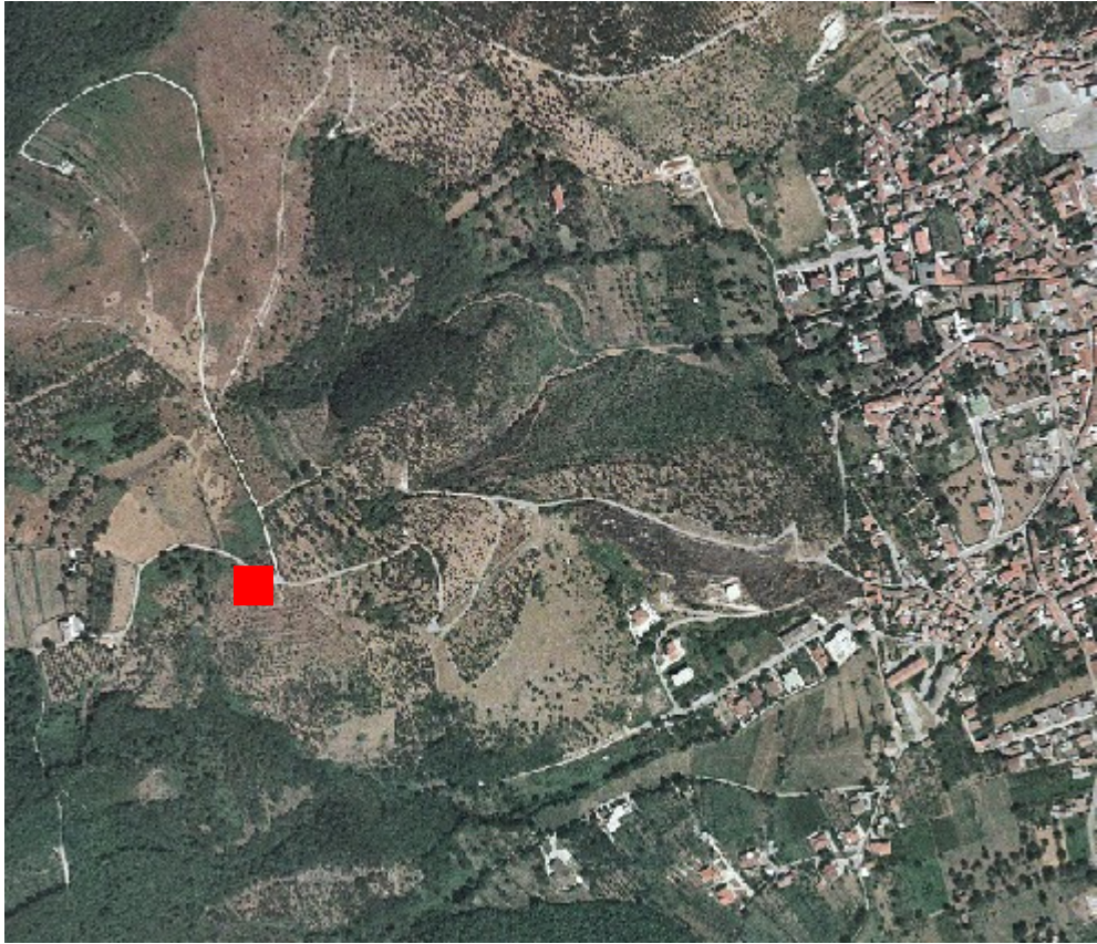
Foto aerea con localizzazione sito stazione