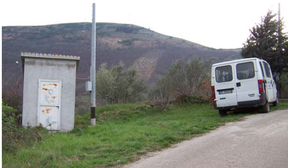
Stazione RAN Airola