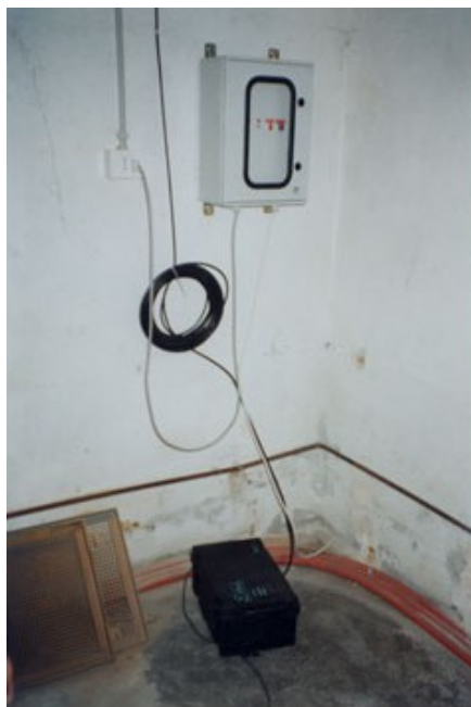
Sede della postazione