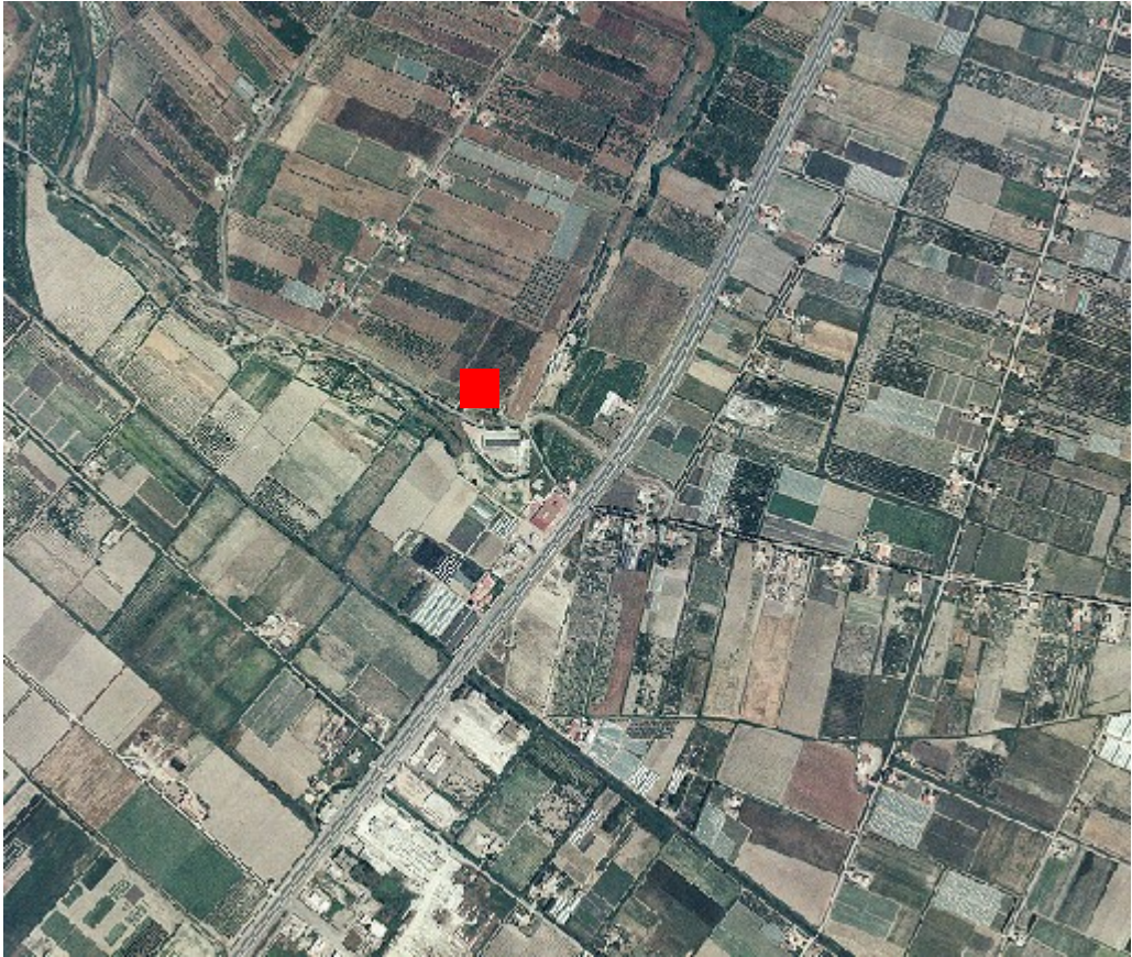
Foto aerea con localizzazione sito stazione