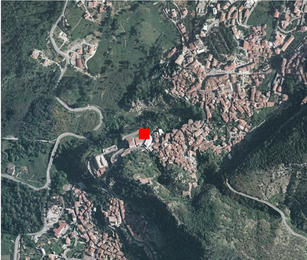
Foto aerea con localizzazione sito stazione