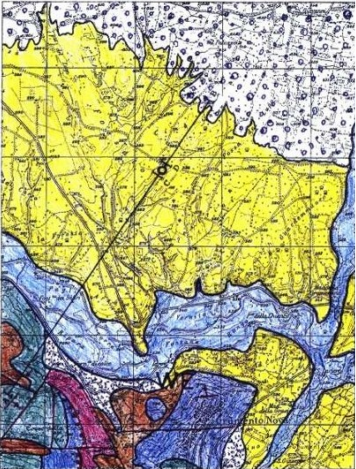
Carta geologica estratta dalle monografie dell'Enel