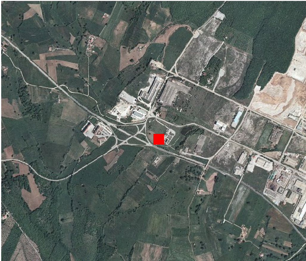
Foto aerea con localizzazione sito stazione