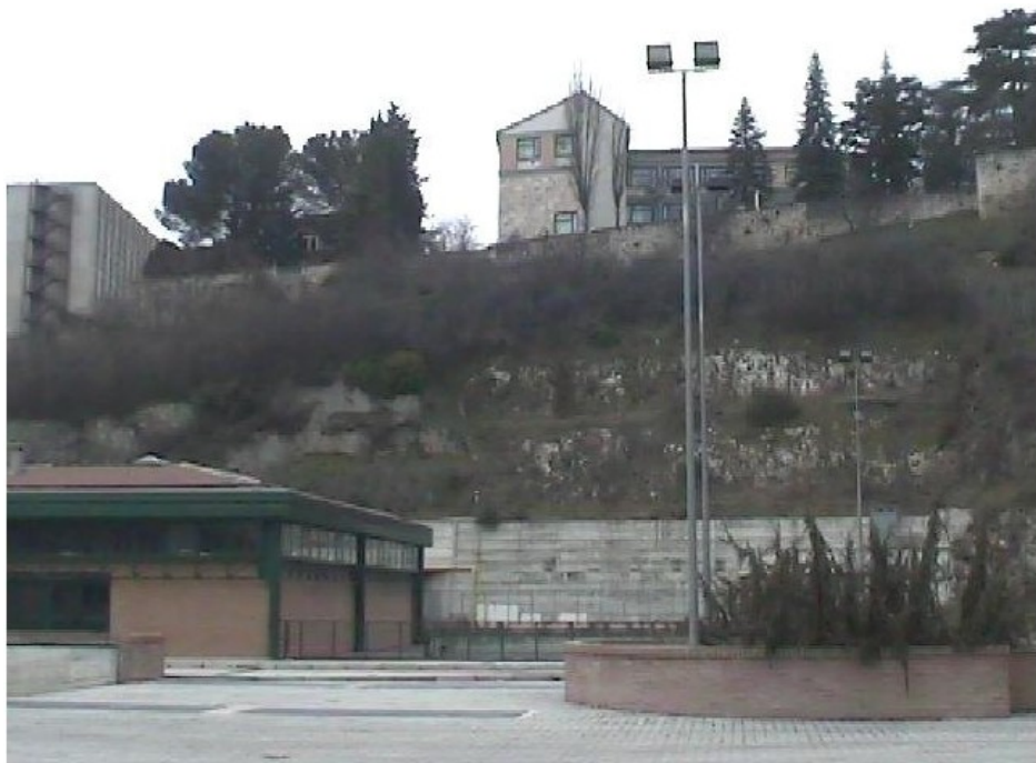
Sede della postazione