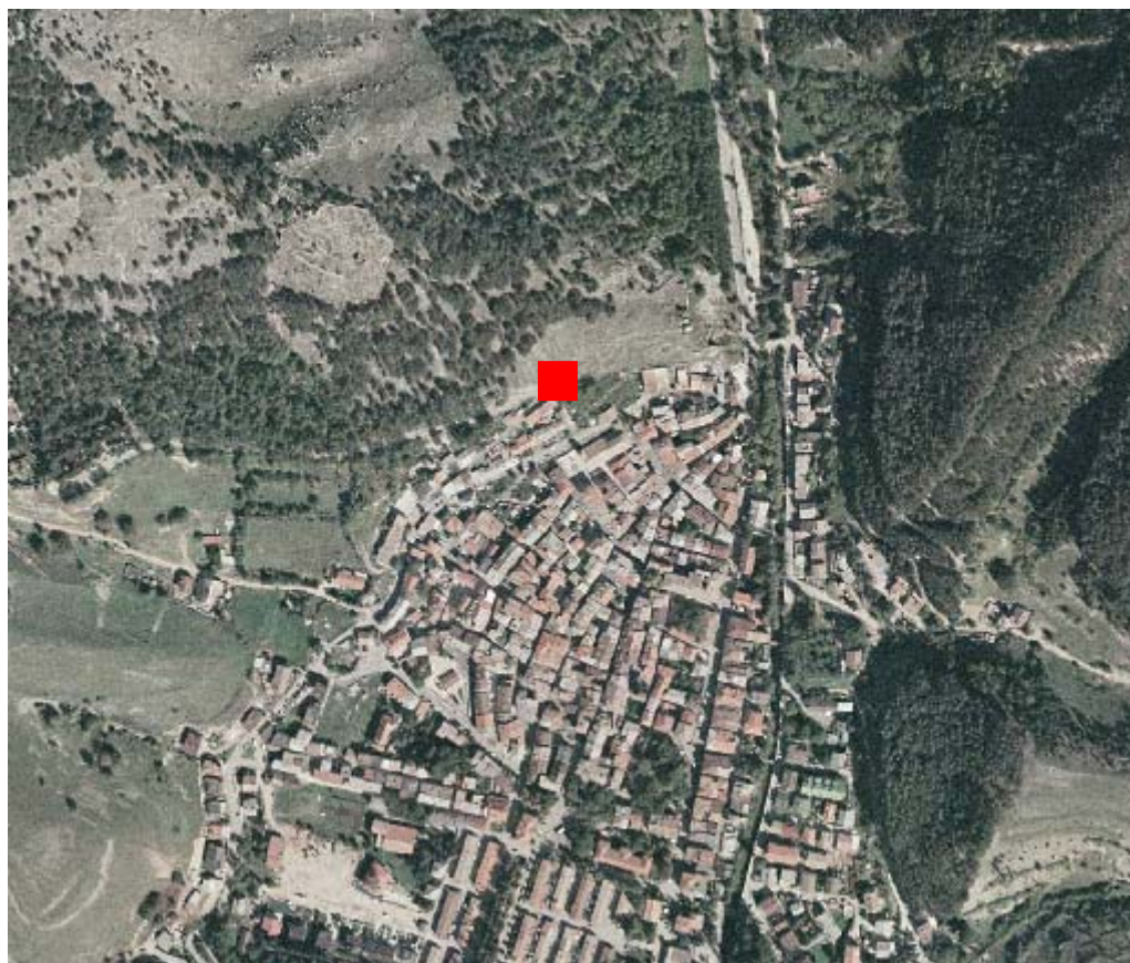
Foto aerea con localizzazione sito stazione