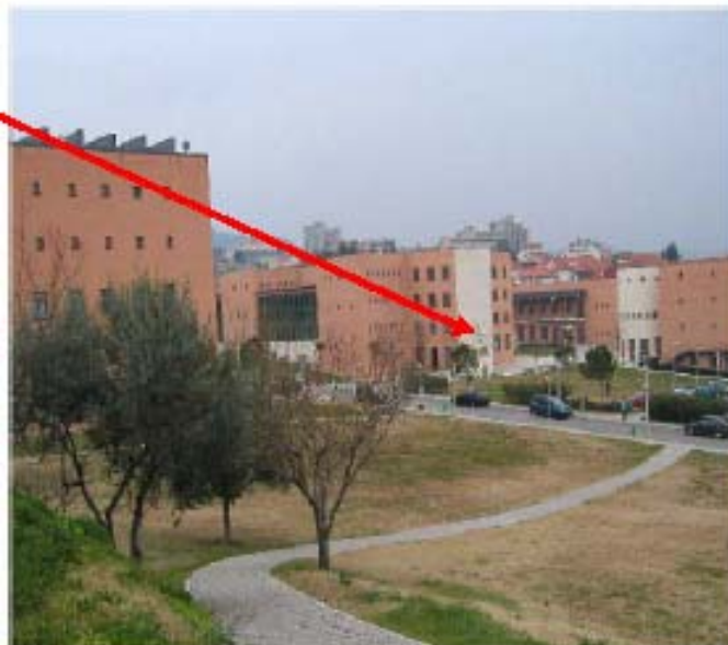
Sede della postazione