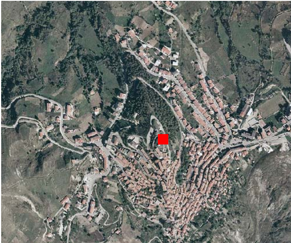
Foto aerea con localizzazione sito stazione