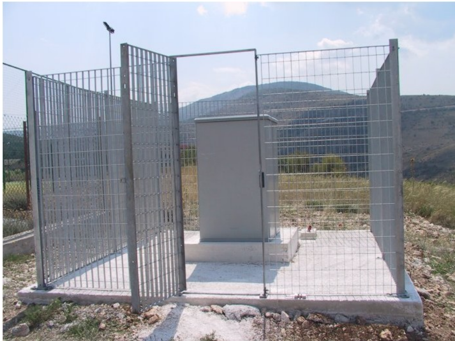
Sede della postazione