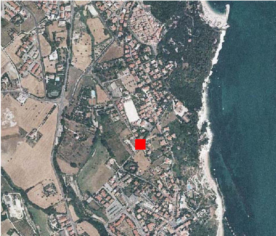
Foto aerea con localizzazione sito stazione