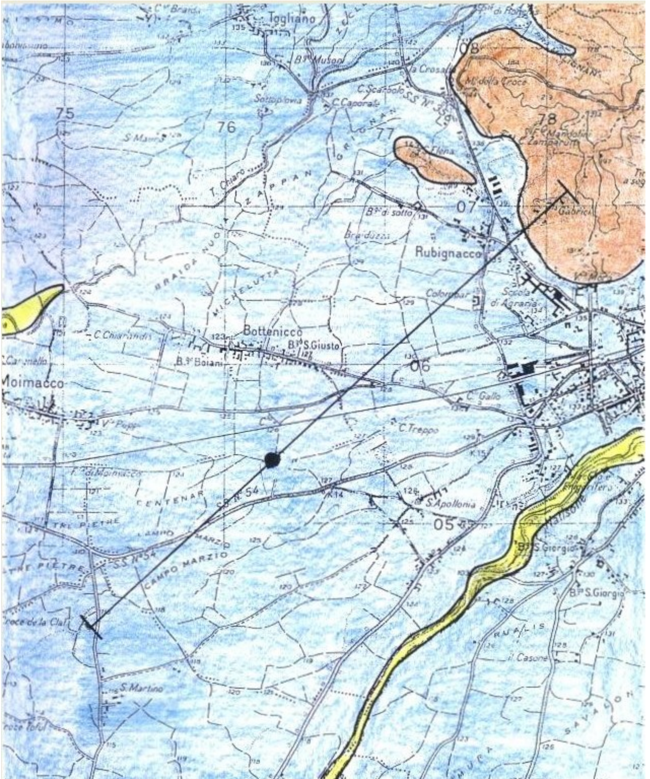
Carta geologica estratta dalle monografie dell'Enel