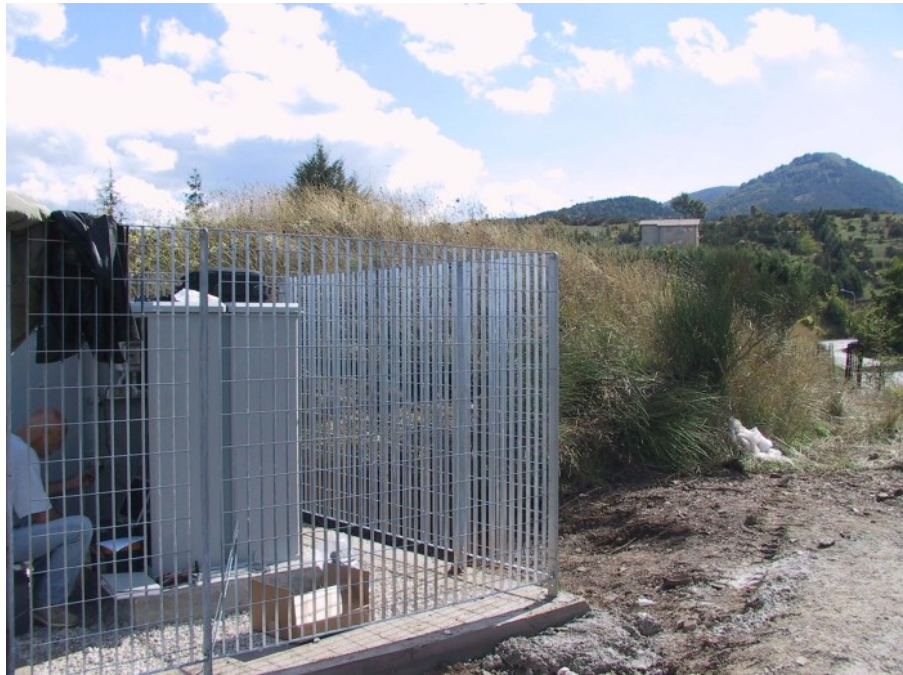
Sede della postazione